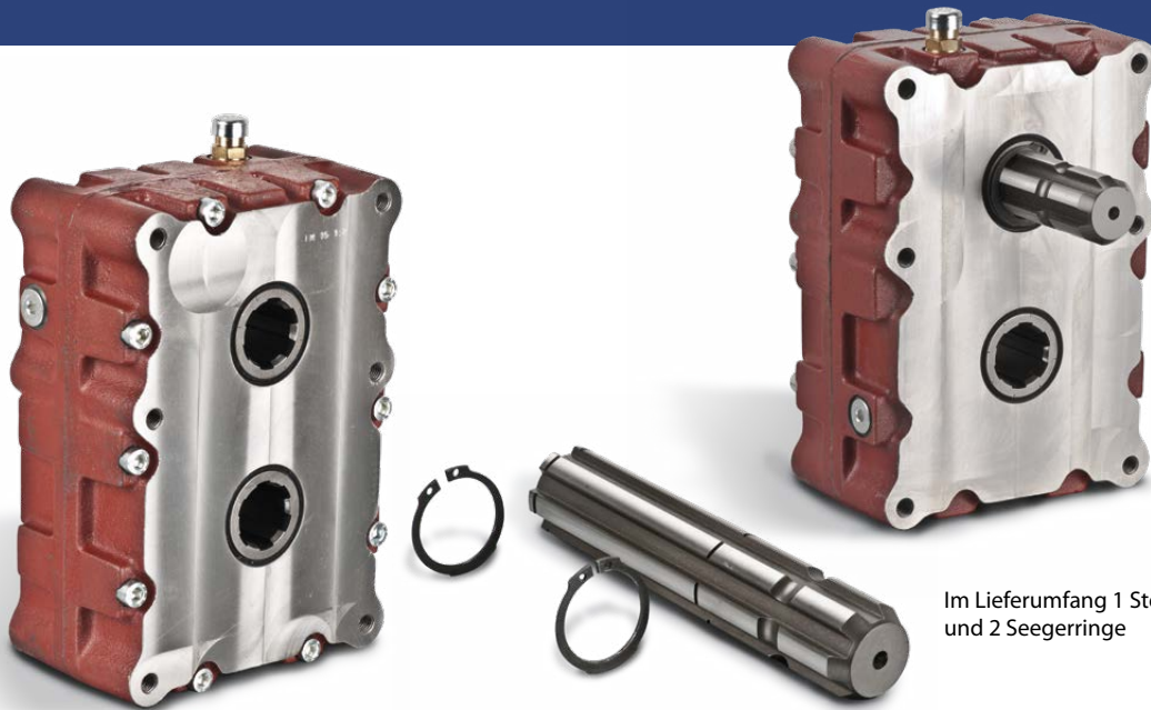
Im Lieferumfang 1 Steckwelle und 2 Seegerringe