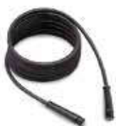
10m Hochdruckschlauch 315 bar - 150°C mit zwei Schnellschraubkupplungen 3.8007.TBAP25324

Durch die Verwendung von hochwertiger Einzelkomponenten