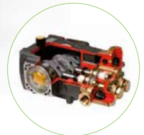
Kurbelwellen-Pumpe mit volkeramischen Kolben und Edelstahlventilen