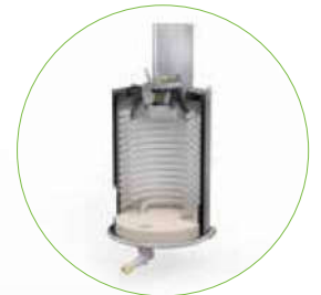
Brenner mit Edelstahlgehäuser